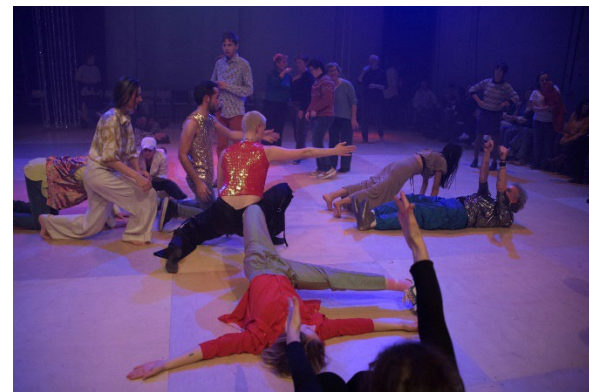
Ballrooms 2023