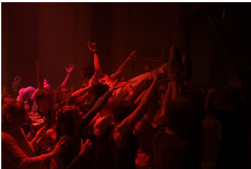
Ballrooms 2023 | © Sofie De Backere