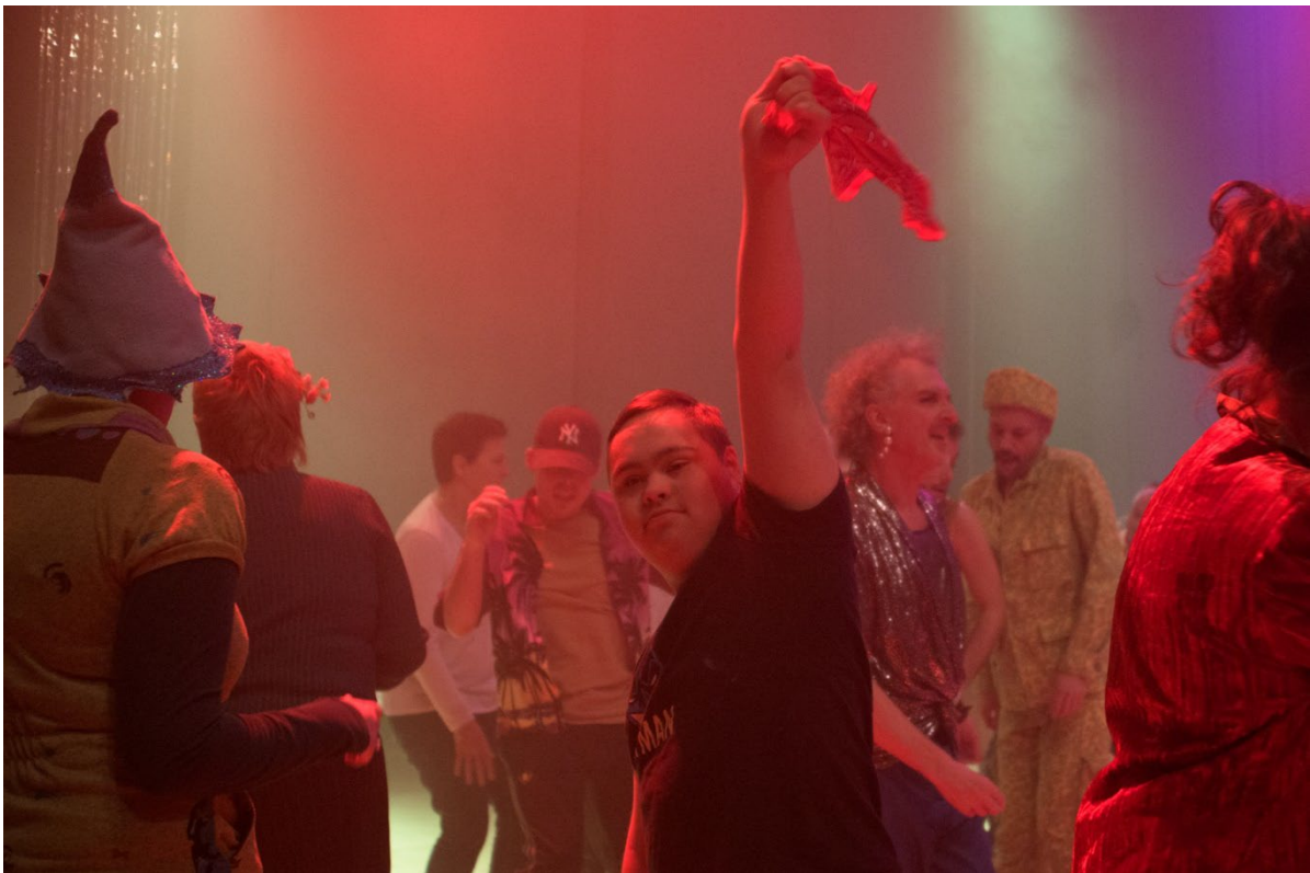
Ballrooms 2023

Andrew Graham | Co-productie laGeste (Gent) en l'Autre Maison (Marseille)