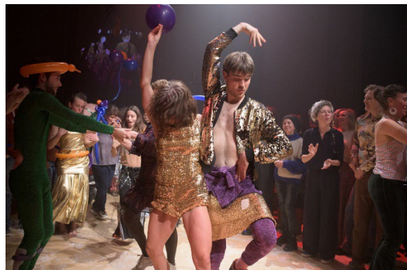
Ballrooms 2023