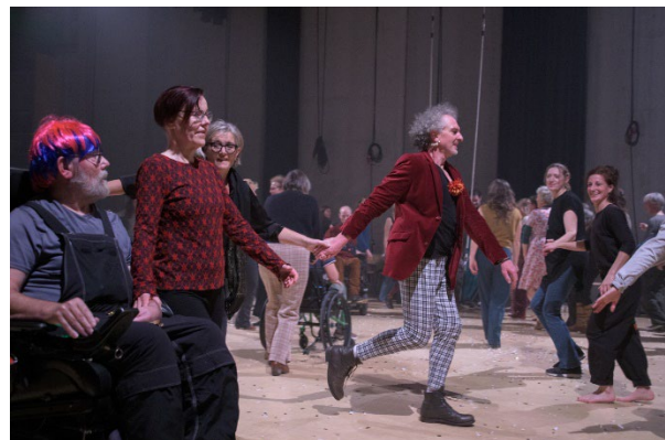
Ballrooms 2023