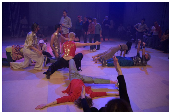
Ballrooms 2023